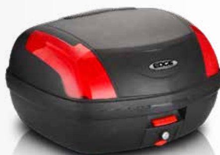
889 Baúl 46 LTS