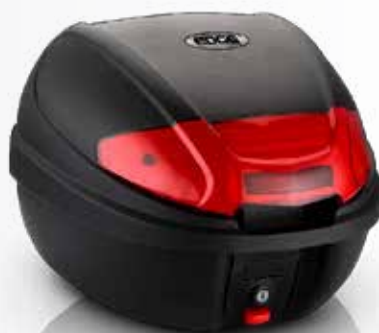
877 Baúl 30 LTS