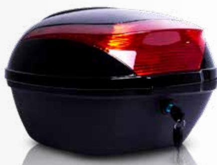
HF-938 Baúl 24 LTS