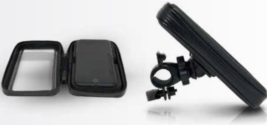
ED-W1 Forro de celular Impermeable Color: Negro