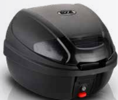
830 Baúl 30 LTS