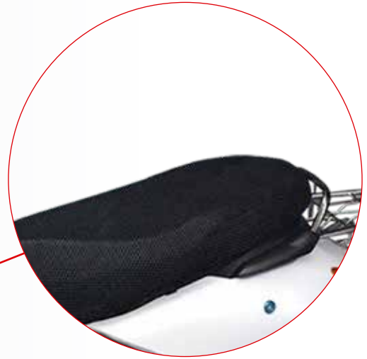
ED-M001 Malla de Asiento