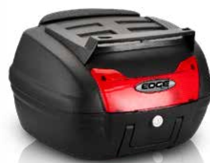
879 Baúl 40 LTS