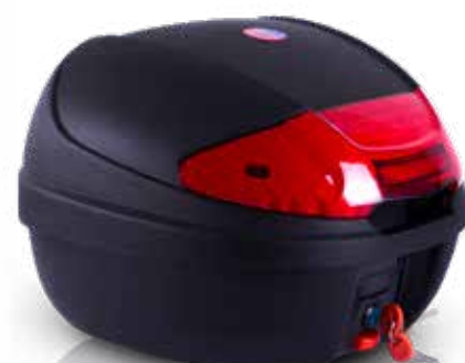
830 Baúl 30 LTS