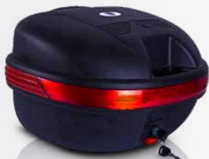
809 Baúl 27 LTS