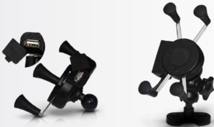
ED-J120 Soporte para celular con cargador Color: Negro