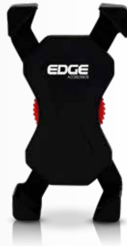
ED-X2 Holder Sin cargador Color: Negro