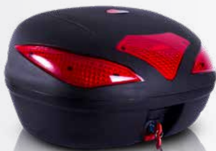
885 Baúl 43 LTS