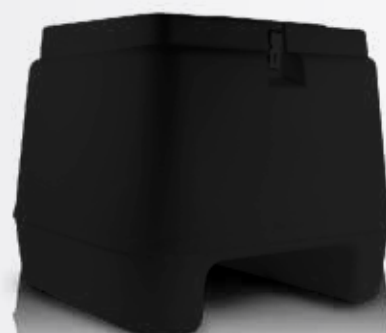
HFX-130L Baúl 130 LTS