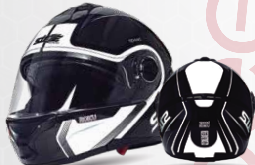
speed ROKU Negro/Gris/Blanco ST117.38