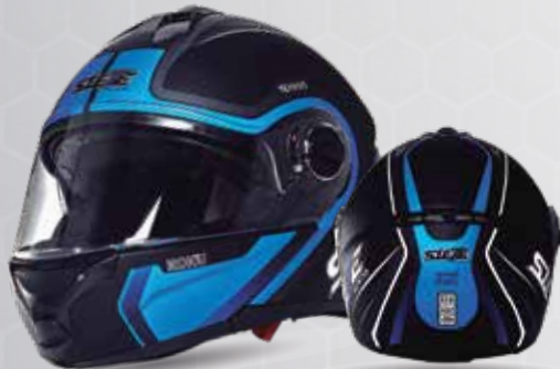
speed ROKU Negro/Azul/Gris /Blanco ST117.33