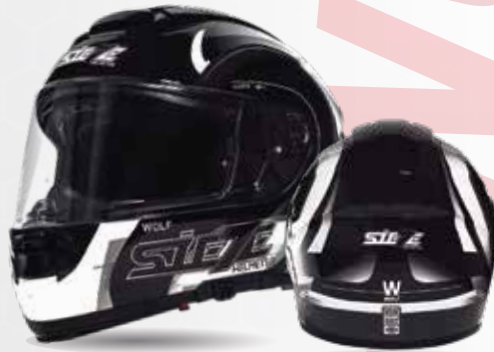
W-WOLF Negro/Gris/Blanco ST017.27