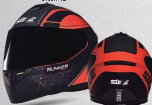
RUNNER SHARK Negro/Naranja/Blanco ST007.12