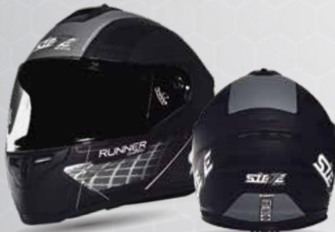
RUNNER SHARK Negro/Gris/Blanco ST007.112