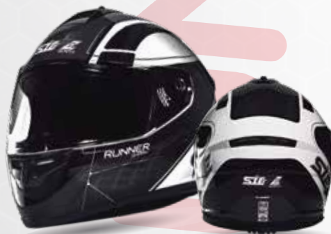
RUNNER SHARK Negro/Gris/Blanco ST007.17