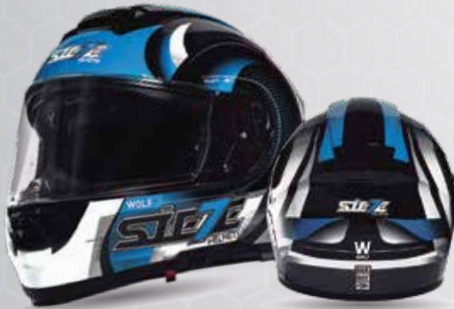
W-WOLF Negro/Azul Brillante/ Blanco ST017.212