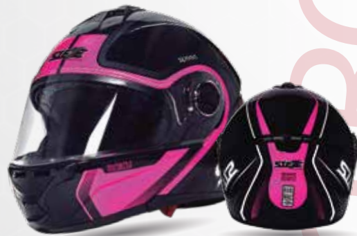
speed ROKU Negro/Magenta/Gris /Blanco ST117.35