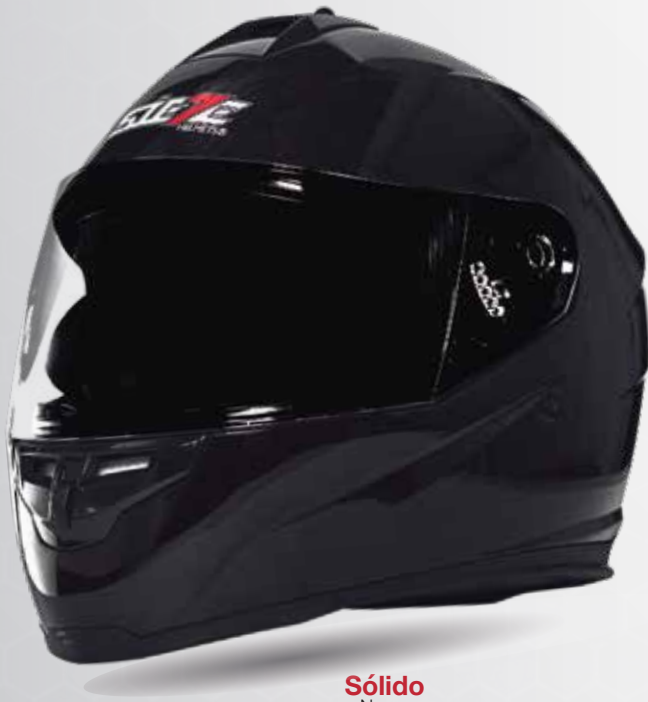
Sólido Negro ST007.0