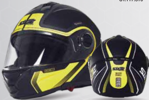
speed ROKU Negro/Amarillo/Gris /Blanco ST117.36