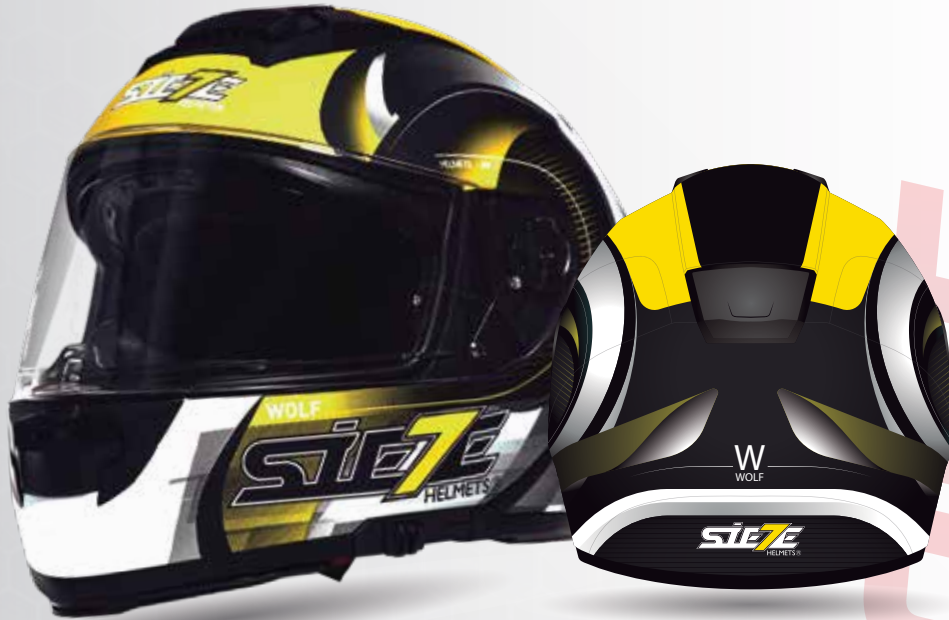
W-WOLF Negro/Amarillo/ Blanco ST017-26