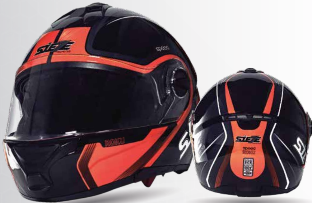
speed ROKU Negro/Naranja/Gris /Blanco ST.117.310