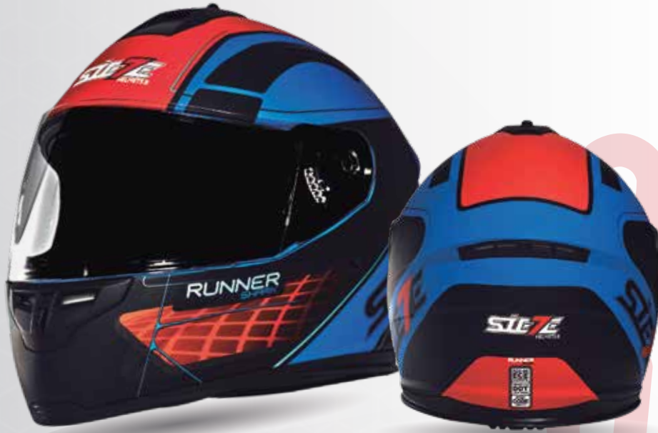
RUNNER SHARK Negro/Azul/Naranja ST007.13