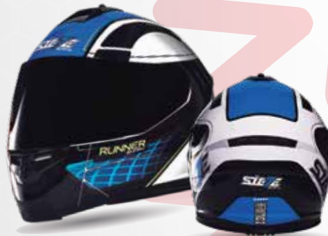
RUNNER SHARK Negro/Azul/Blanco ST007.18