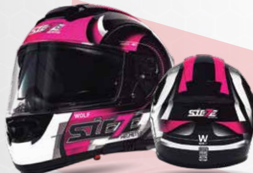
W-WOLF Negro/Magenta/ Blanco ST017.25