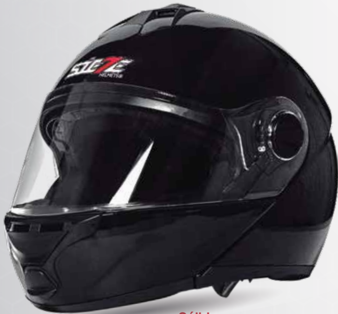
Sólido Negro ST117.07