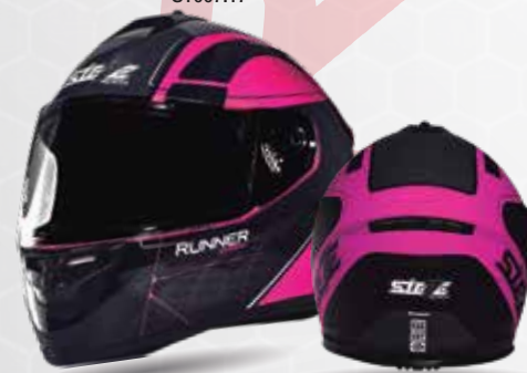
RUNNER SHARK Negro/Fuscia/Blanco ST007.15